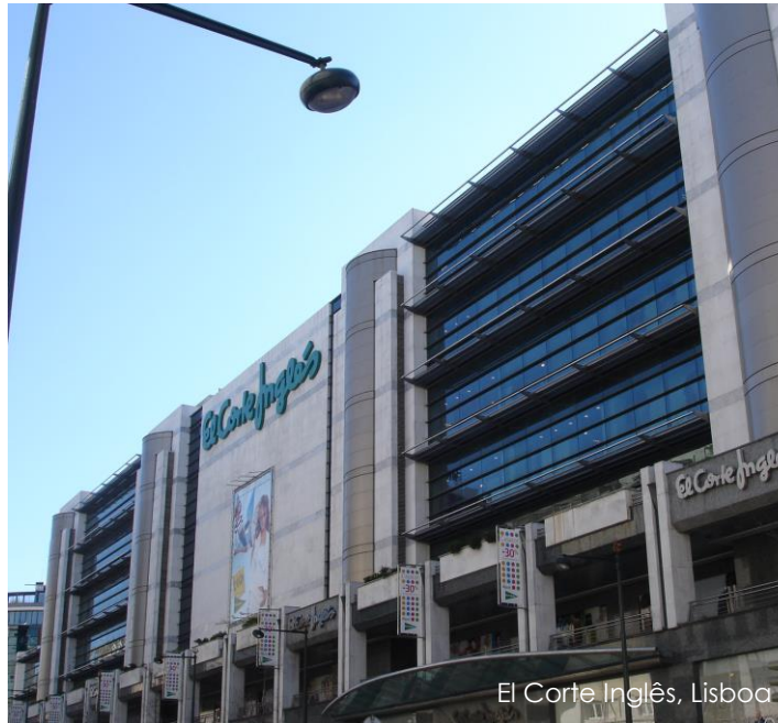
El Corte Inglés, Lisboa