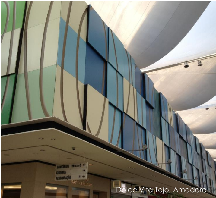
Dolce Vita Tejo, Amadora