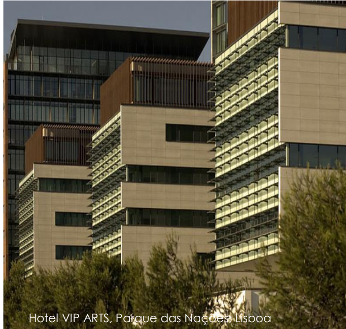
Hotel VIP ARTS, Parque das Nações, Lisboa