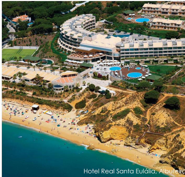
Hotel Real Santa Eulália, Albufeira