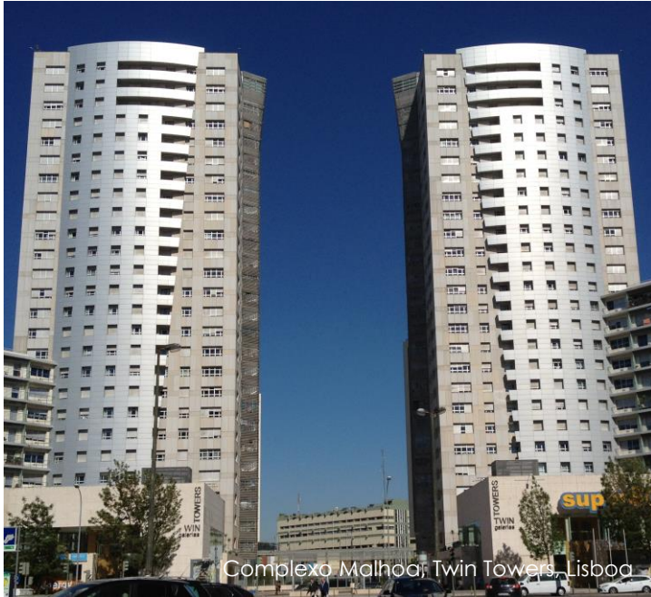
Complexo Malhoa, Twin Towers, Lisboa