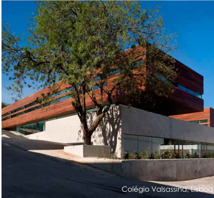
Colégio Valsassina, Lisboa