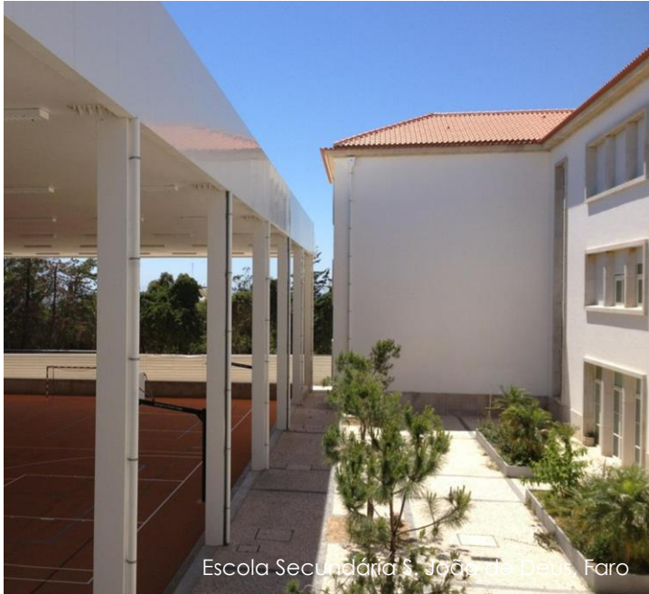
Escola Secundária S. João de Deus, Faro