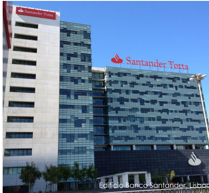
Edifício Banco Santander, Lisboa