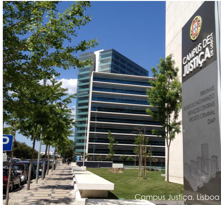
Campus Justiça, Lisboa