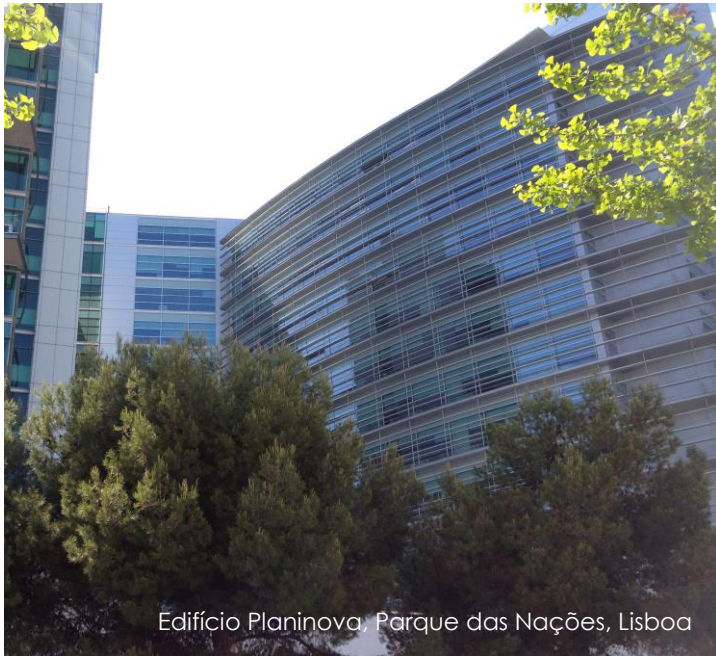
Edifício Planinova, Parque das Nações, Lisboa