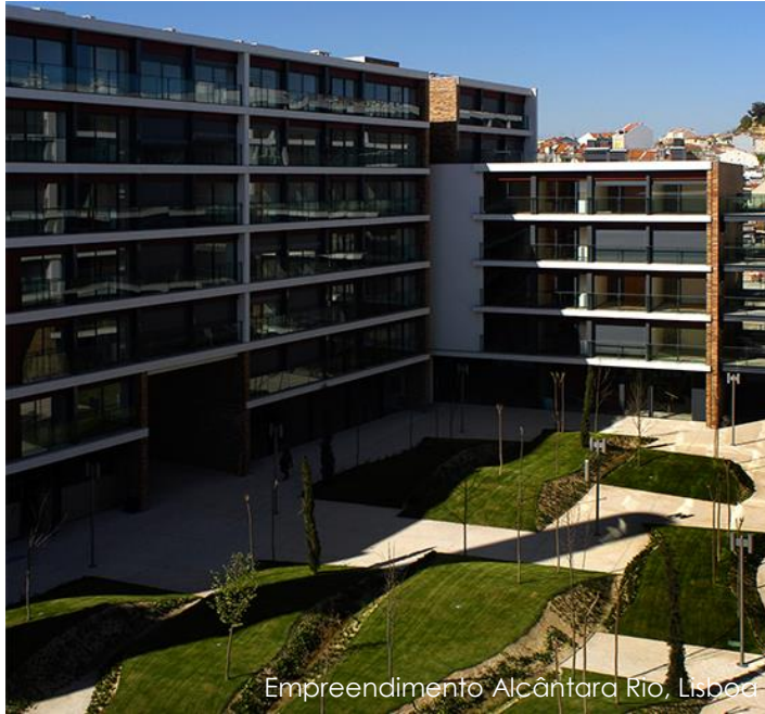
Empreendimento Alcântara Rio, Lisboa