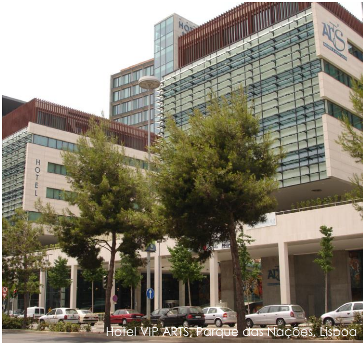
Hotel VIP ARTS, Parque das Nações, Lisboa