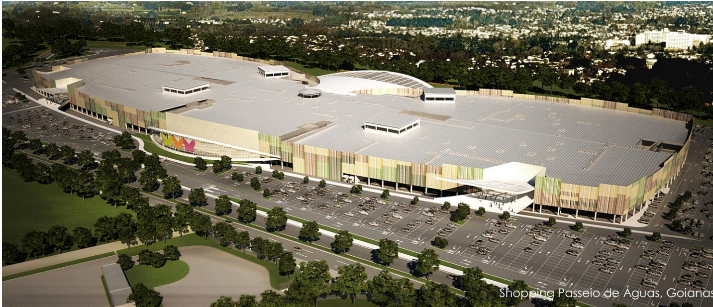
Shopping Passeio de Águas, Goianás