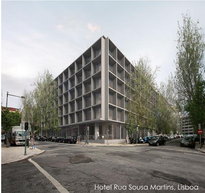
Hotel Rua Sousa Martins, Lisboa