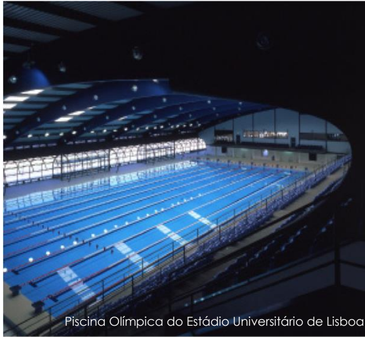
Piscina Olímpica do Estádio Universitário de Lisboa