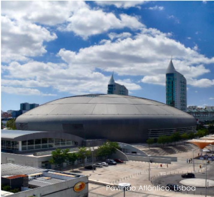
Pavilhão Atlântico, Lisboa