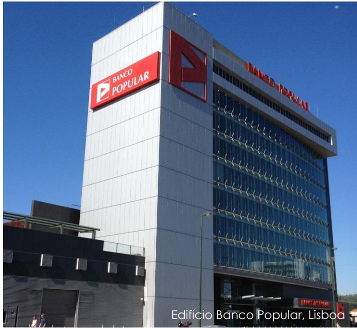
Edifício Banco Popular, Lisboa